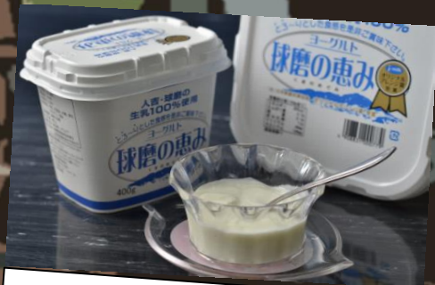
《球磨酪農農業協同組合》 球磨の恵みヨーグルト