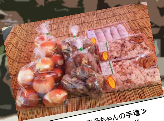
《JAくま女性部母ちゃんの手塩》 生鮮野菜、こめっこパンなど