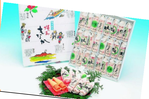
《寅家》 焼酎もなか、なんさまよか人吉など