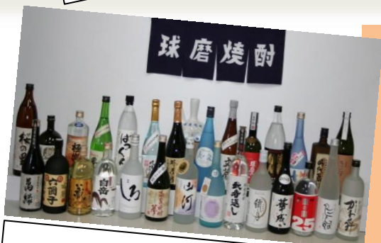
《球磨焼酎酒造組合》 球磨焼酎

人吉の魅力がいっぱい！ 平成28年1月21日(木)・22日(金) 開催時間／午前11時～午後7時 ※22日は午前9時から 場 所／小倉駅JAM広場 (北九州市小倉北区浅野1丁目1-1)