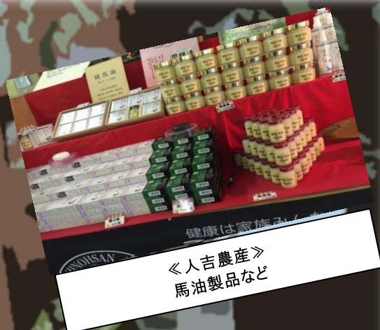
《人吉農産》 馬油製品など