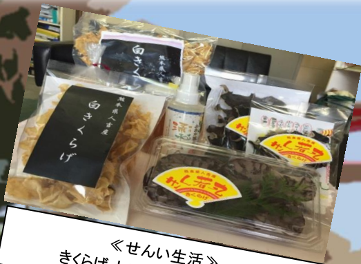
《せんい生活》 きくらげ・しいたけの加工品など