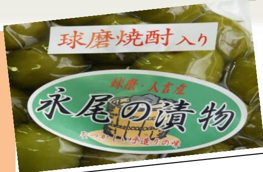
《永尾商店》 上高菜漬、人吉の焼酎梅、キムチなど

人吉の魅力がいっぱい！ 平成28年1月21日(木)・22日(金) 開催時間／午前11時～午後7時 ※22日は午前9時から 場 所／小倉駅JAM広場 (北九州市小倉北区浅野1丁目1-1)